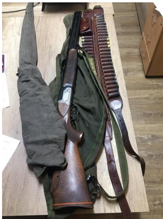
Конфискувано оружје при регистриран недозволен лов