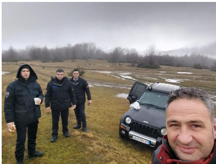
Теренска патрола со гранична полиција