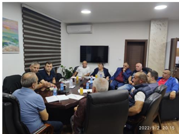
Средби со локално население

Во текот на 2022 година ЈНУПШП оствари средби со претставници на другите национални паркови во Македонија и воспостави директен контакт со мрежата на заштитени подрачја - паркови Динариди. Како конкретно продолжение на дискусијата се прошири воспоставувањето контакт со НП Копаоник во однос на плаќањето на екосистемските услуги. Претставници од ЈНУПШП го посетија Националниот парк Копаоник во Република Србија, каде беше утврден првиот чекор за идна соработка помеѓу двата парка.