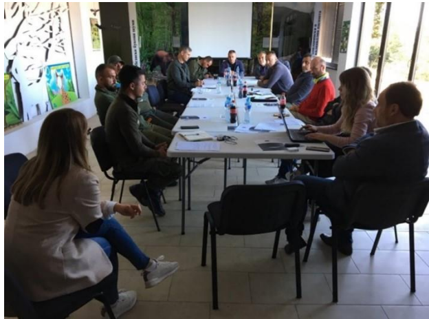
Размена на искуства со другите НП и нивната опрема.