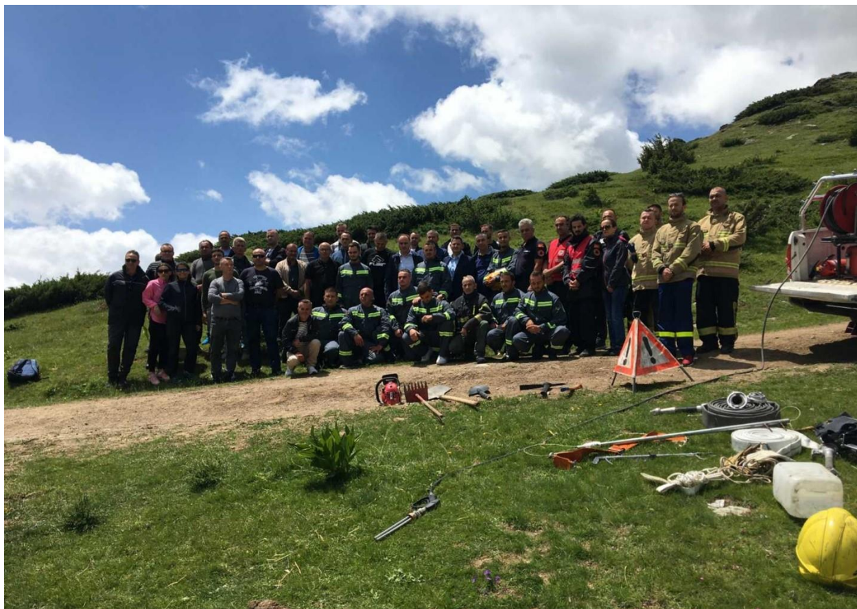
Учесници на противпожарната обука