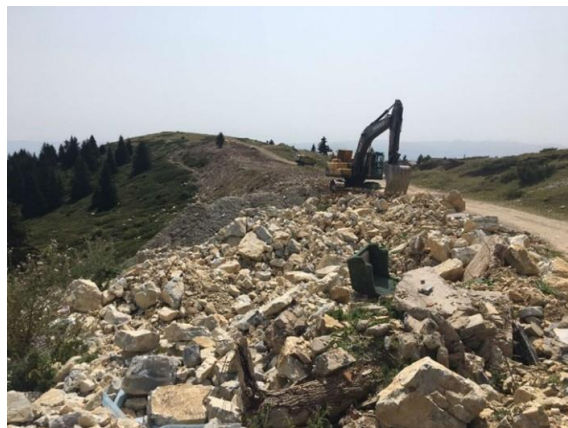
Чистење на нелегални депонии во НП