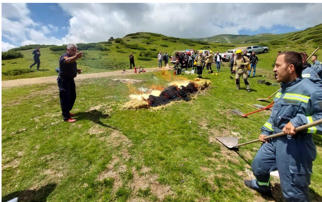
Противпожарната обука, Попова Шапка, јуни 2022 година