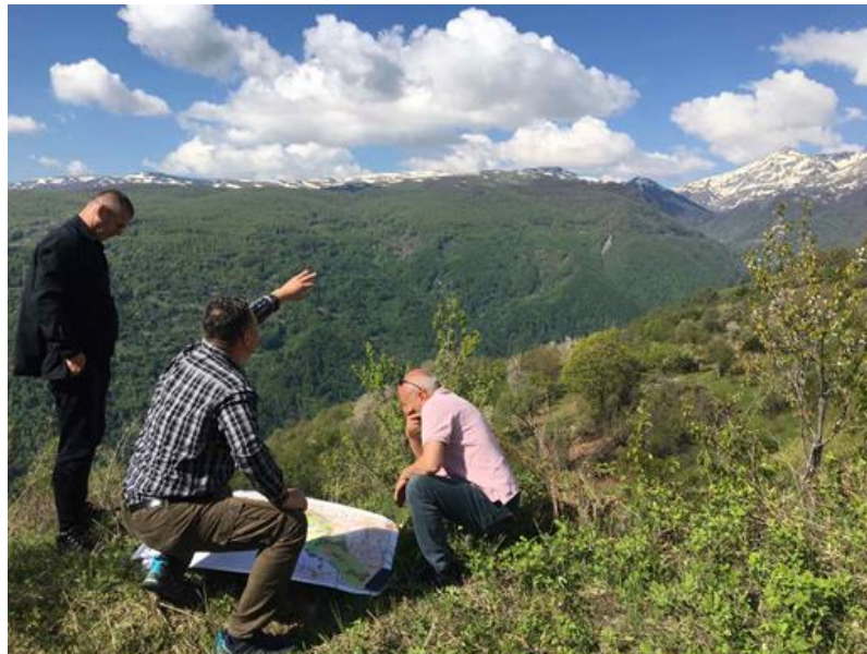
Посета на претставник на Глобалната организација за заштита на природата