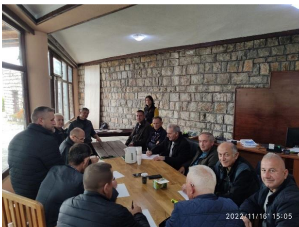
Средби со претставници на ловни друштва