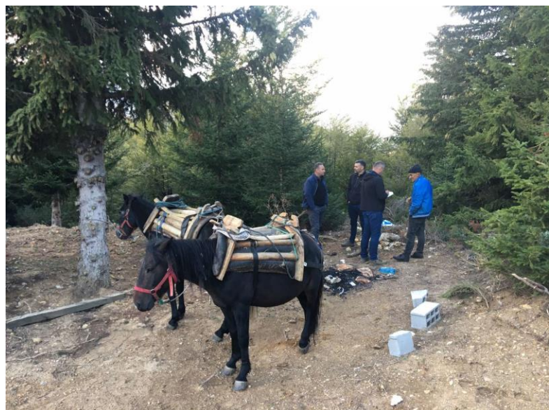
Регистрирани активности за нелегално обезбедување на огревно дрво