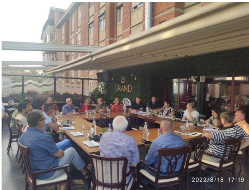
Средба со претставници на планинарски клубови

Беше воспоставена конструктивна комуникација и соработка со Здружението на Волонтери пожарникари, каде тие покажаа подготвеност да помогнат на ЈУНПШП во иднина кога ќе има шумски пожари на територијата на Националниот парк Шар Планина. Во периодот на јуни-јули беше одржана обука за 30 лица и беше потпишан меморандум за соработка.