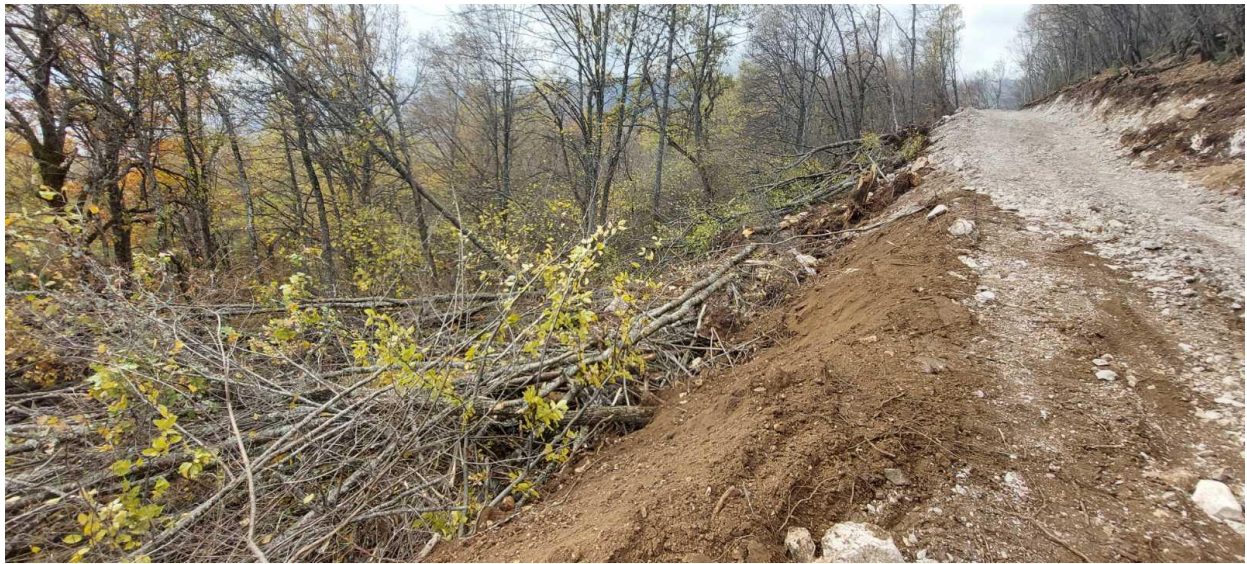
Нелегално изграден пат