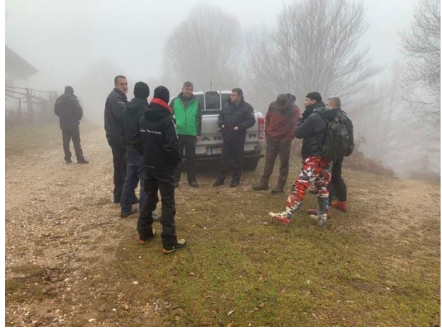
Теренски патроли со редовна полиција