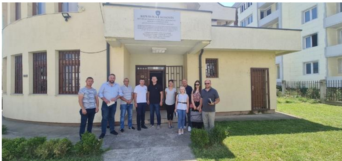
Работна средба во Косово

Во текот на 2022 година, управата на ЈУНПШП одржа бројни продуктивни средби со сите Општини кои спаѓаат во границите на НП и воспоставени се директни комуникациски линии со претставниците на Општините. Како еден од најконкретните резултати на оваа остварена соработка треба да се спомене соработката со Општина Гостивар која се обврза да обезбеди монтажен објект во центарот на Гостивар за потребите на ЈУНПШП. Потпишувањето на меморандумот е планирано за 2023 година.