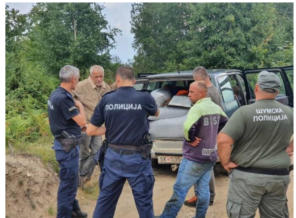
Зедничка патрола со граничната и шумската полиција