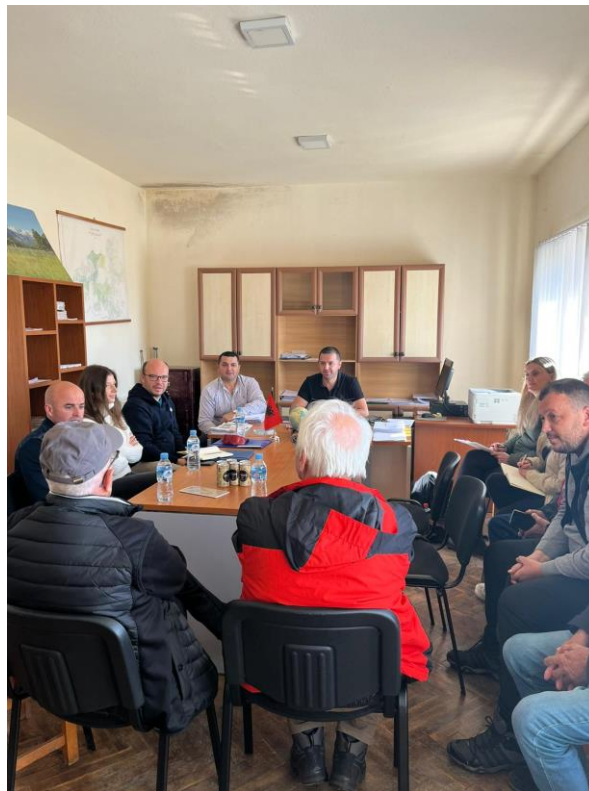
Посета на Албанија

Во тек на 2022 година беше организирана активност во рамките на грантот на Планинарскиот клуб Љуботен поддржан од ПОНТ и се реализираше студиското патување во Националните паркови во Валбона и Тетх со цел посета на сместувачки капацитети, кетеринг објекти, агенции кои работат во областа на планинскиот туризам и средби со претставници од споменатите ентитети. На студиското патување присуствуваа претставници од ЈУНПШП кои остварија средби со претставниците на двата парка и се запознаа со применетите методологии за тоа како пристапуваат кон нелегалните активности што се случуваат во заштитните зони и со оваа се изврши надоградување на познавањата од оваа област.