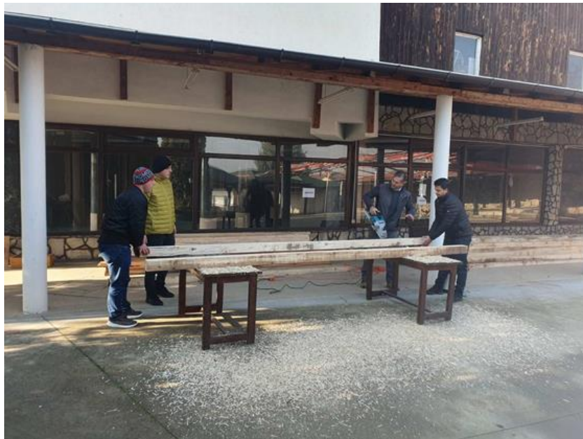
Градење на информативни табли