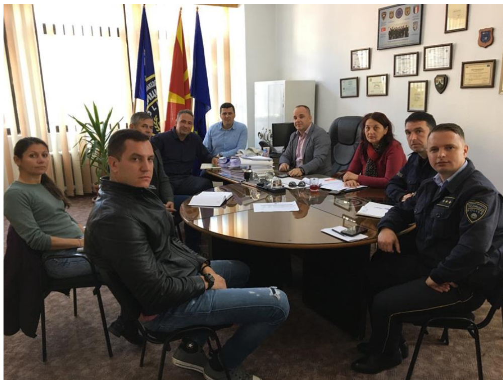
Средба со претставници на полиција во Полициското одделение во Гостивар