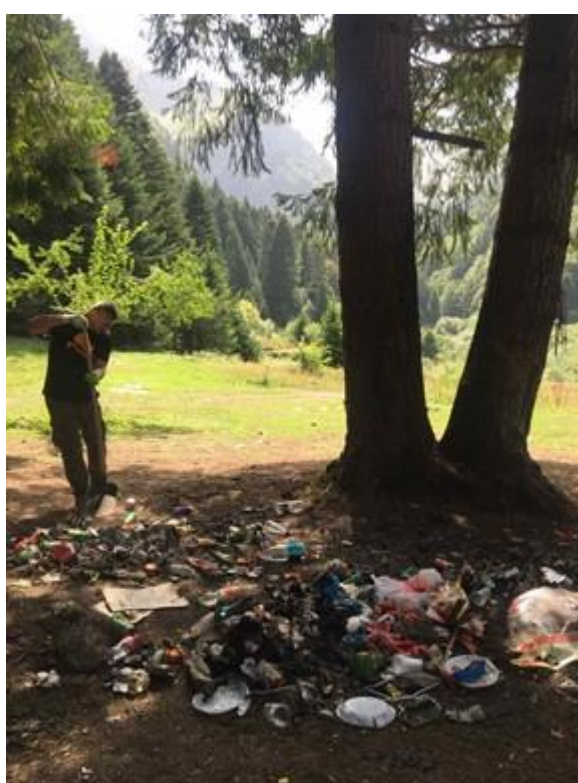
Чистење на отпад на места за пикник во организација на НП