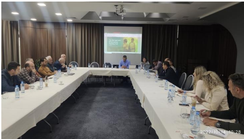
Состанок со совет на засегнати страни