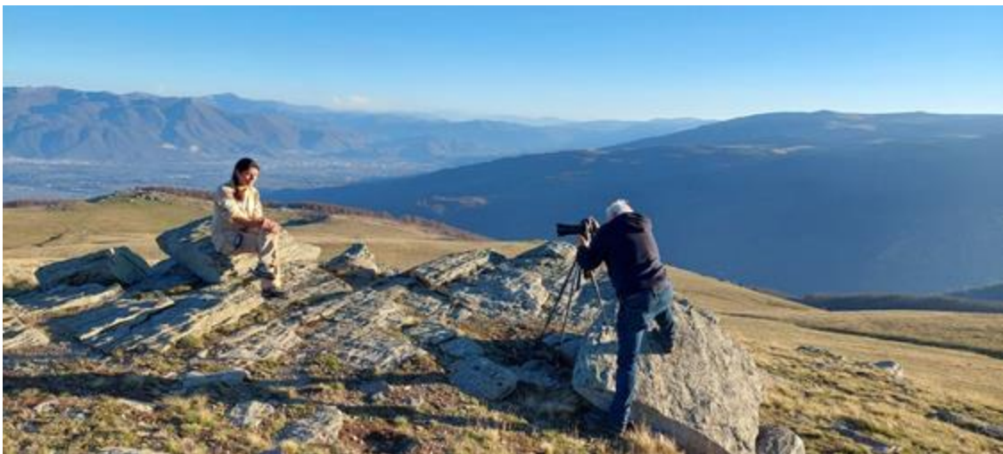
Подготовка на промотивното видео