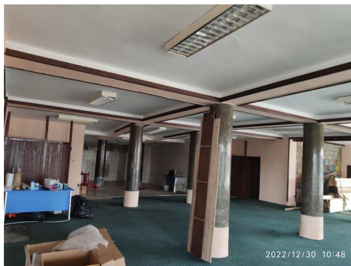
Канцелариите на ЈУНПШП

На ден 30.09.2022, Јавната Установа Национален парк Шар Планина, Република Северна Македонија и Друштвото за туризам угостителство рекреација и спорт ЕЛЕМ ТУРС ДООЕЛ Скопје склучија Договор за отстапување на правото на користење на дел од недвижен имот бр. 343-04/01, а врз основа на Одлуката од Управниот одбор на АД Електрани на Македонија, во државна сопственост, Скопје, УО бр.02-4748/327/6 од 19.08.2022, со што недвижен имот-дел од деловна зграда, Ресторан со тоалет, намена на објектот - деловна зграда вон стопанство, со површина од 308 м 2 евидентирана во Имотен лист бр. 27706, за КО Тетово 2, лоцирана на ул. „Мурат Бафтијари“ бб Тетово, дел од приземно ниво со вкупна површина од 437 м 2 , се дава на користење без надомест на неопределено време на Јавната Установа Национален парк Шар Планина, Република Северна Македонија со што се обезбедуваа соодветен работен простор за вработените во ЈУНП Шар Планина, Република Северна Македонија. Со ова е реализирана активноста 8.1.2 Обезбедување соодветни работни простории за вработените во органот за управување со заштитеното подрачје од Потпрограмата за институционално зајакнување на заштитеното подрачје на Годишниот план за работа (точка 5.8.1. од Планот за управување).