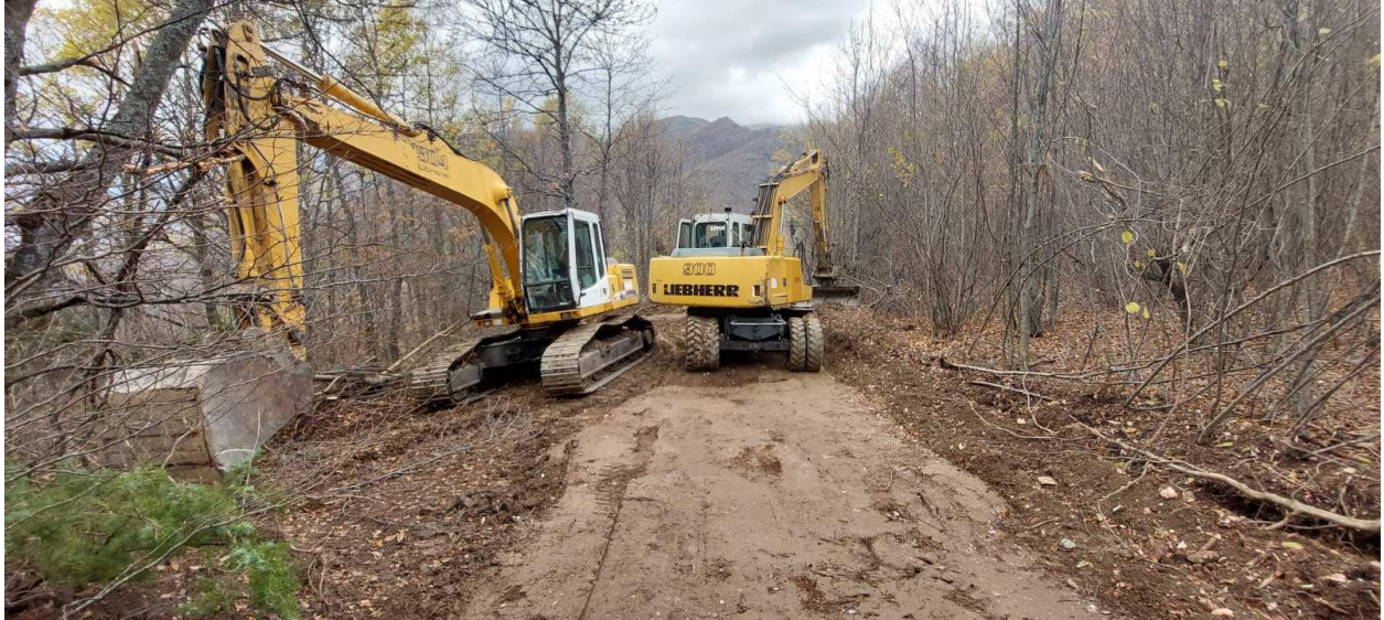
Утврдено неодобрено отворање на пат на територија на НП Шар Планина