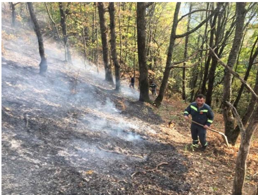
Борба против шумски пожари